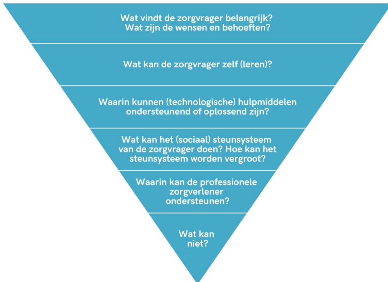
Figuur 2 Stappen in de verkenning van zelfredzaamheid van zorgvrager en steunsysteem (Reijngoudt & van Dorst, 2024)

piramide dient van boven naar beneden gelezen te worden en dient bij iedere evaluatie opnieuw doorlopen te worden.