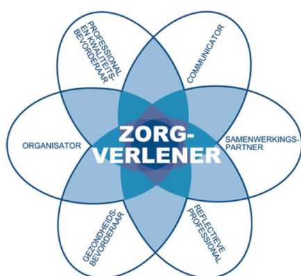
Figuur 1. CanMEDS-systematiek

In dit document wordt bij elke CanMEDS-rol een korte, algemene beschouwing op de rol van de research professional binnen het Expertisegebied beschreven. Vervolgens worden per rol in grote lijnen de generalistische kennis en vaardigheden uit het Beroepsprofiel beschreven. Vervolgens worden per rol de aanvullende, specifieke kennis en vaardigheden beschreven die een helder beeld geven van hetgeen de research professional uniek maakt ten opzichte van andere zorgprofessionals. De generalistische kennis en vaardigheden uit het Beroepsprofiel vormen samen met de aanvullende beschrijving van de research professional één geheel, en bestrijken samen het volledige gebied waarin de research professional werkzaam is. Afhankelijk van de functieomschrijving en kwalificatieniveau zijn wel/ of niet delen van elke afzonderlijke rol van toepassing.