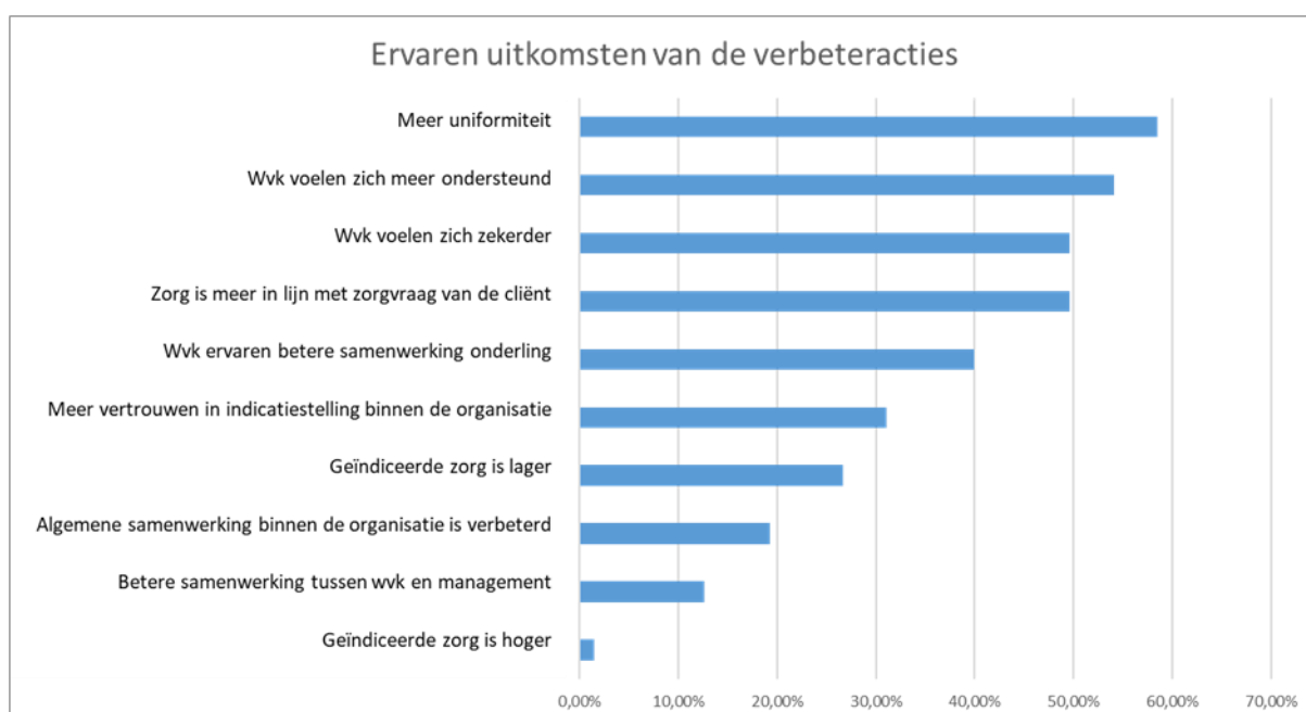
Figuur 3. De ervaren uitkomsten van de verbeteracties